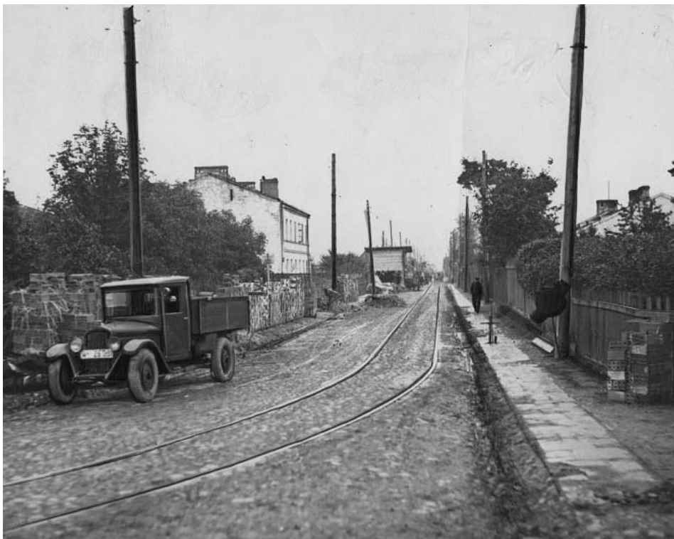
Tory kolejki EKD na Szczęśliwiczach (ulica Szczęśliwicka), koniec lat 20. ubiegłego wieku

Tymczasem wartość działek na Okęciu i Rakowie wzrosła. W 1923 r. doprowadzono tu linię tramwajową. Od ul. Opaczewskiej ulicą Grójecką (od administracyjnego końca Warszawy nazywaną Szosą Krakowską, a w latach trzydziestych Aleją