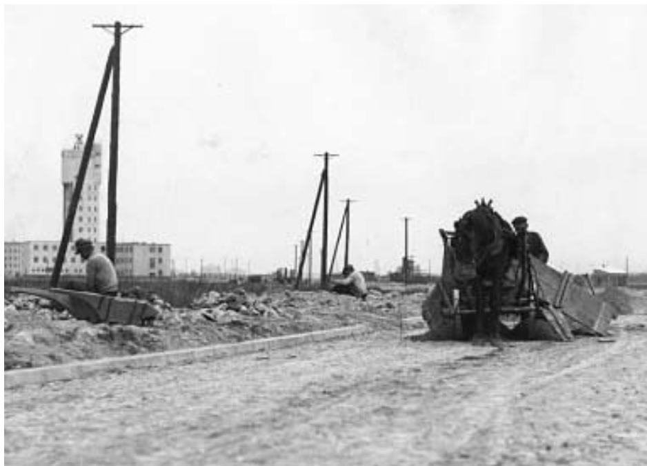
Budowa Al. Żwirki i Wigury. Furman wysypuje żwir utwardzający drogę. W tle nowowymbudowana wieża sygnalizacyjna lotniska. Wiosna 1934 rok

Rzecz jasna naczelną inwestycją było lotnisko. Przypomnijmy, że w Warszawie dotychczasowe lotnisko znajdowało się na Polu Mokotowskim. Teren ten stawał