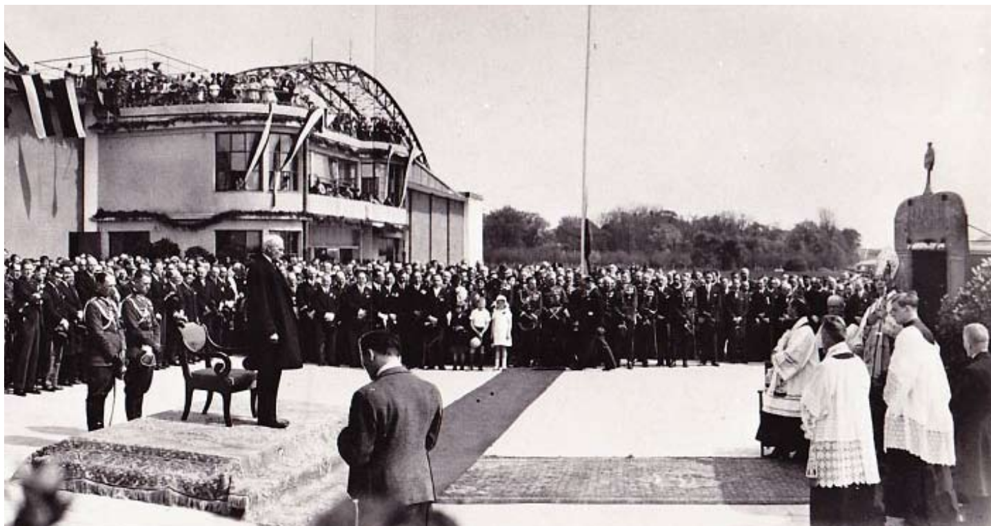
Uroczystość otwarcia portu lotniczego Okęcie 29 kwietnia 1934 roku. Prezydent Ignacy Mościcki i jego adiutanci