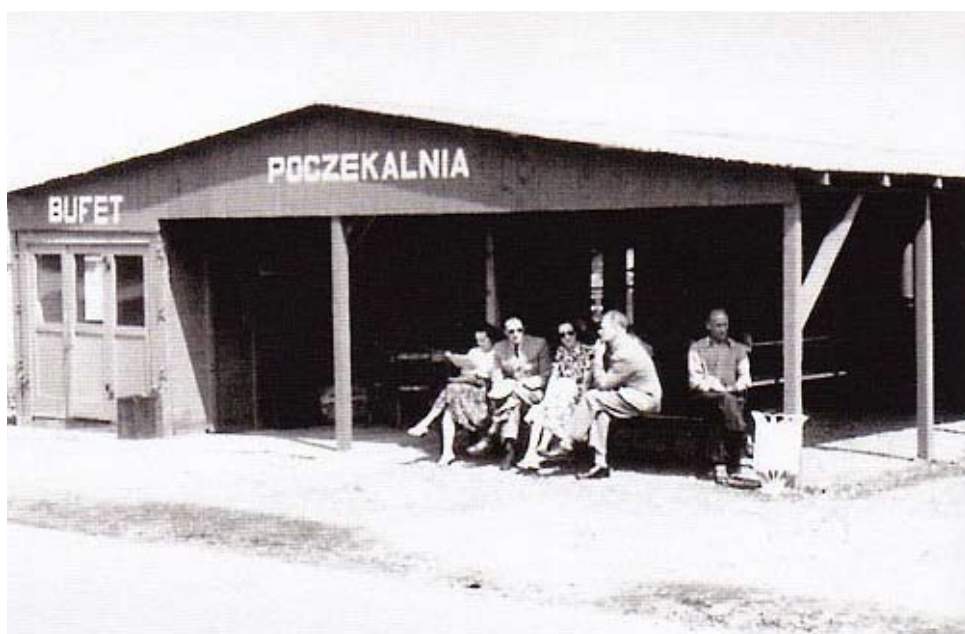
Odbudowa Okęcia, pierwszy „dworzec” lotniczy na zrujnowanym lotnisku

Na Okęciu był zakład produkujący tanie, nie najlepszej jakości wino. Miało ono jednak swoich zwolenników, którzy często powtarzali: „Wino Okęcie jest dobre na rozpoczęcie”