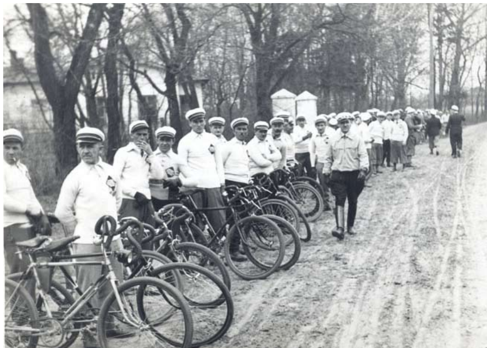
Wycieczka cyklistów z Okęcia do Raszyna ok. 1935 r.