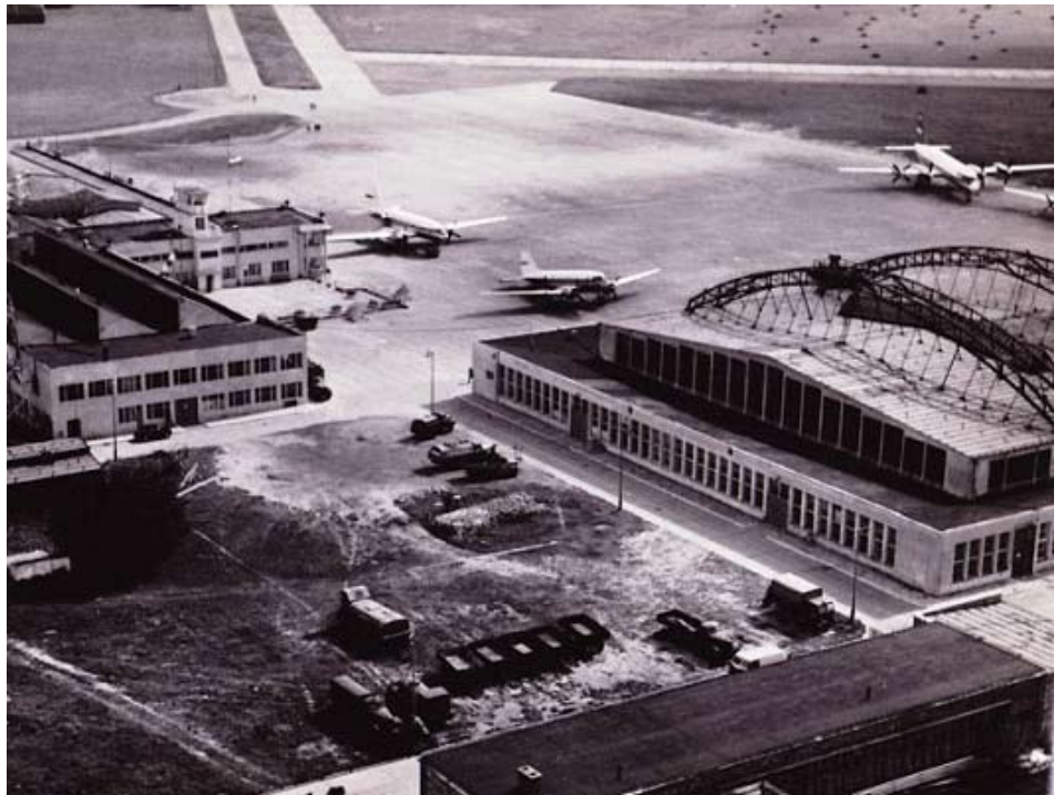
Port lotniczy Okęcie jeszcze przed przebudową, którą przeprowadzono w 1969 r.

W końcu XIX w. te oba osiedla nie były wielkie. Okęcie wraz z odgradzającym go od szosy krakowskiej Rakowem mogło liczyć kilkuset mieszkańców, głównie żyjących z rolnictwa. Ośrodkiem kultury był dwór państwa Bagniewskich, wybudowany w 1854 r. przez architekta Orłowskiego. Dwór ten otaczał park, przez który leniwie przepływała niewielka rzeczka – Sadurka (o której coś więcej pisałem w poprzednim numerze „Ochotnika”) tworząc kilka stawów. Niestety, poza stawem, nazwanym na pamiątkę owej życiodajnej Sadurki i stojącej w pobliżu ponad 100 letniej kapliczki, nic nie przypomina o dworkowo-sielankowej przeszłości tych stron. Dwór podupadł w czasie II wojny, a jego ruiny zaorano,