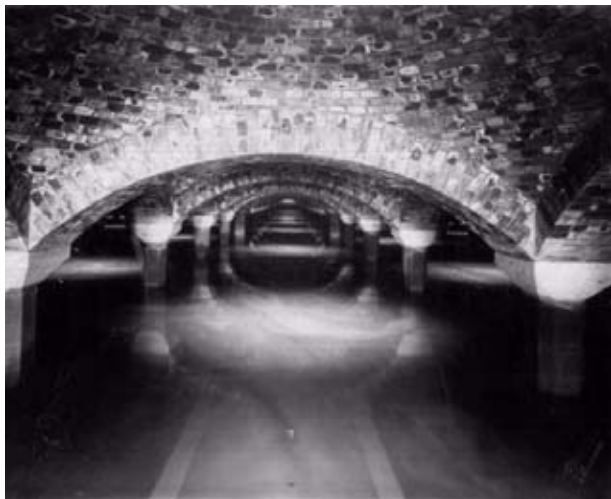
Wnętrze filtra powolnego w latach międzywojennych

A i owszem. Moją największą dumą, symbolem wręcz i czymś, co nadaje mi charakter są Filtry. Codziennie zachwyca mnie niezwykle połączenie praktyczności, myśli technicznej, nowoczesności z tradycją, urodą i może trochę tajemniczością. Proszę sobie wyobrazić, że one działają od ponad 100 lat, a pierwszy poważny remont był przeprowadzony dopiero w latach 90. ubiegłego wieku. Latem można zwiedzać Stację Filtrów – gorąco polecam taką wycieczkę. Zapraszam też do Muzeum Motoryzacji.