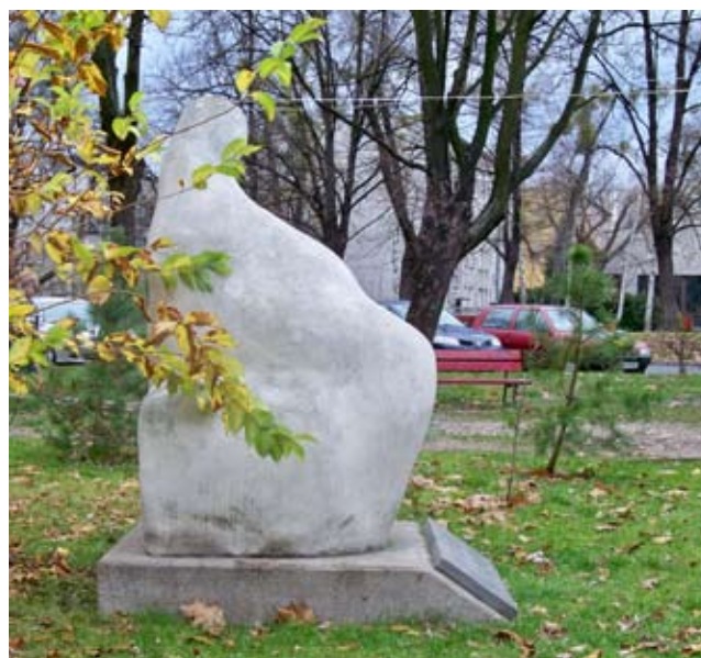
„W hołdzie macierzyństwu” (róg Opaczewskiej i Biało-brzeskiej)