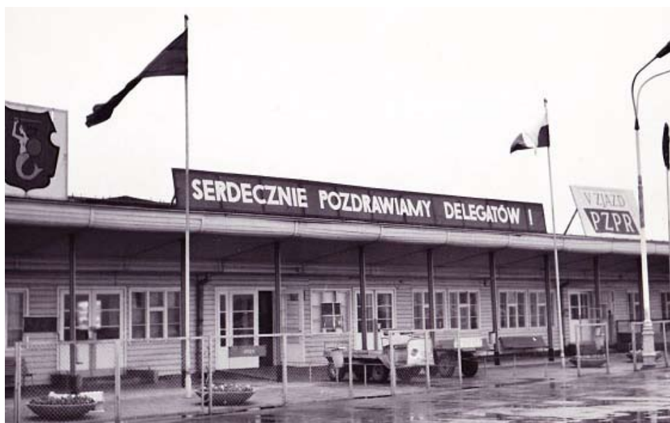
Krajowy port lotniczy listopad 1968 r.