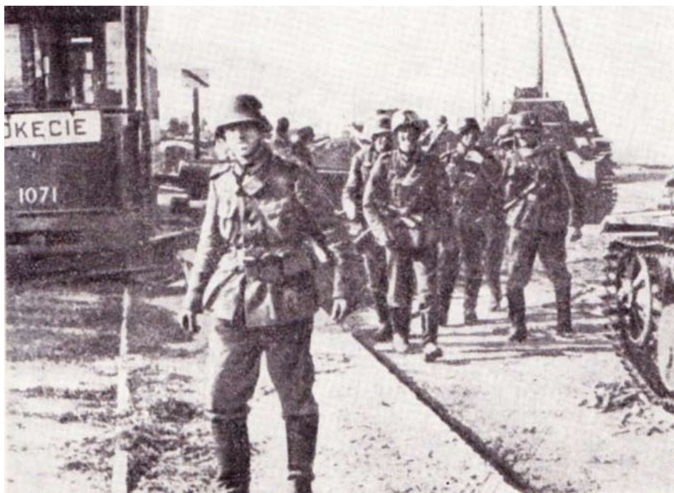
Zdjęcie z książki „Dzieje Ochoty” przedstawia atak Niemców na Ochotę od strony Okęcia