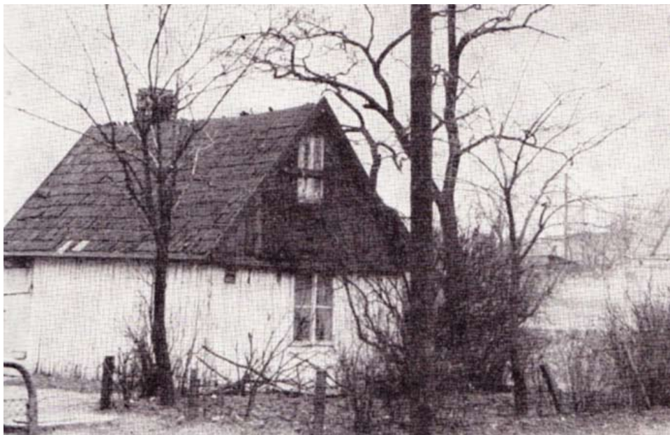
Dom na Okęciu, w którym w czasie wojny odbywały się narady PPR

W 1951 r. Okęcie przyłączono do Warszawy (do gminy Ochota). Od 1994 r. Okęcie wchodzi w skład dzielnicy Włochy.